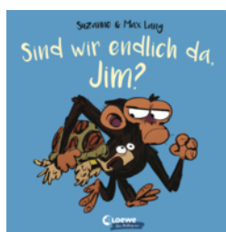
Sind wir endlich da, Jim?