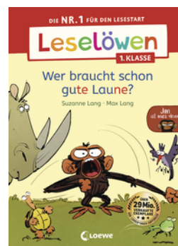
Leselöwen 1. Klasse - Jim ist mies drauf - Wer braucht schon gute Laune?