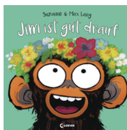
Jim ist gut drauf