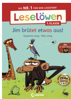
Leselöwen 1. Klasse - Jim ist mies drauf - Jim brütet etwas aus!