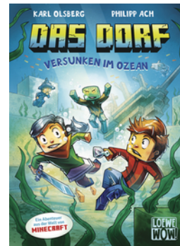
Das Dorf (Band 5) - Versunken im Ozean