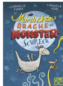
Mondscheindrache und Monsterschreck