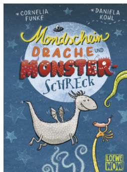
Mondscheindrache und Monsterschreck