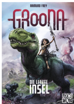
Groona - Die letzte Insel