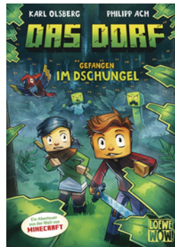
Das Dorf (Band 3) - Gefangen im Dschungel