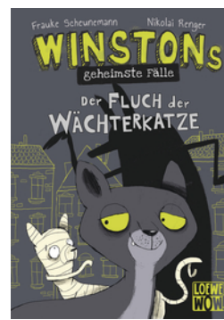
Winstons geheimste Fälle (Band 1) - Der Fluch der Wächterkatze