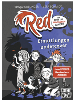
Red - Der Club der magischen Kinder (Band 2) - Ermittlungen undercover