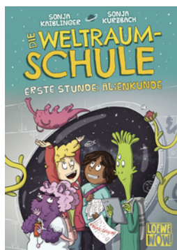
Die Weltraumschule (Band 1) - Erste Stunde: Alienkunde