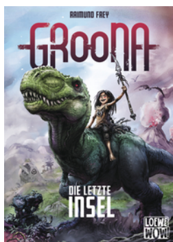
Groona - Die letzte Insel