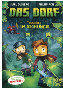
Das Dorf (Band 3) - Gefangen im Dschungel