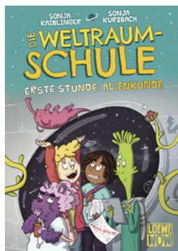
Die Weltraumschule (Band 1) - Erste Stunde: Alienkunde