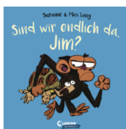
Sind wir endlich da, Jim?