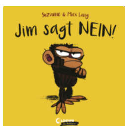
Jim sagt Nein!