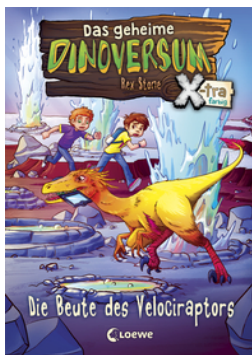
Das geheime Dinoversum Xtra (Band 5) - Die Beute des Velociraptors