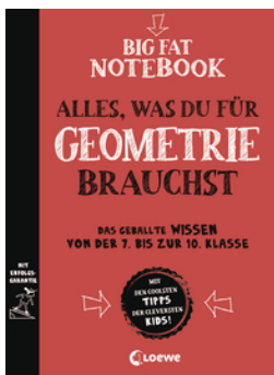
Big Fat Notebook - Alles, was du für Geometrie brauchst