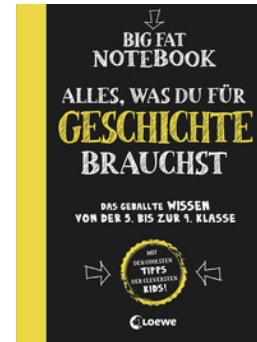
Big Fat Notebook - Alles, was du für Geschichte brauchst