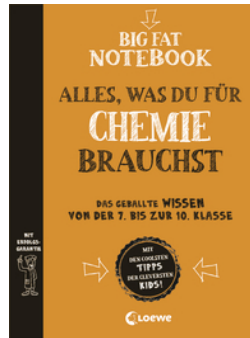
Big Fat Notebook - Alles, was du für Chemie brauchst - Das geballte Wissen von der 7. bis zur 10. Klasse