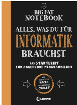
Big Fat Notebook - Alles, was du für Informatik brauchst - Das Starterkit für angehende Programmierer