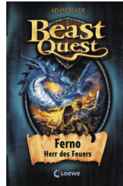
Beast Quest (Band 1) - Ferno, Herr des Feuers