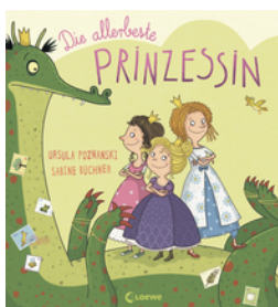
Die allerbeste Prinzessin