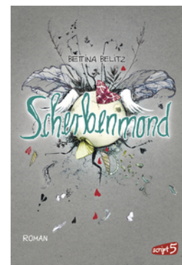
Splitterherz – Scherbenmond