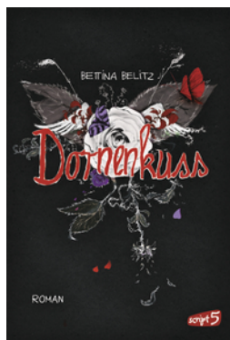
Splitterherz – Dornenkuss