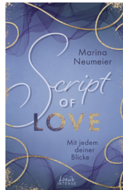
Script of Love - Mit jedem deiner Blicke (Love-Trilogie, Band 2)