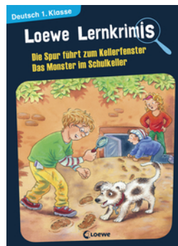
Loewe Lernkrimis - Die Spur führt zum Kellerfenster / Das Monster im Schulkeller