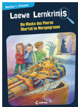
Loewe Lernkrimis - Die Maske des Pharaos / Überfall im Morgengrauen