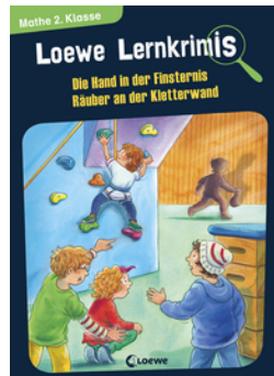
Loewe Lernkrimis - Die Hand in der Finsternis / Räuber an der Kletterwand