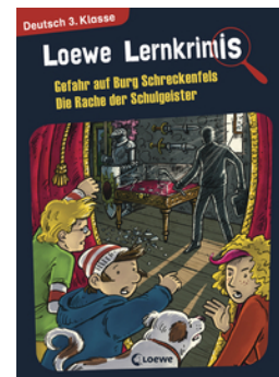
Loewe Lernkrimis - Gefahr auf Burg Schreckenfels / Die Rache der Schulgeister