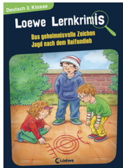
Loewe Lernkrimis - Das geheimnisvolle Zeichen / Jagd nach dem Reifendieb