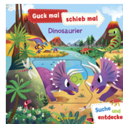
Guck mal, schieb mal! Suche und entdecke - Dinosaurier