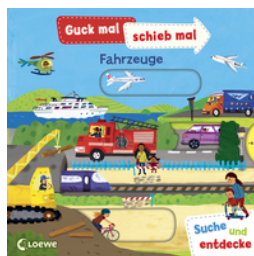
Guck mal, schieb mal! Suche und entdecke - Fahrzeuge