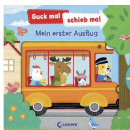
Guck mal, schieb mal! - Mein erster Ausflug