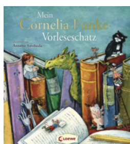
Mein Cornelia-Funke- Vorleseschatz