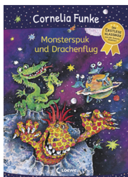
Monsterspuk und Drachenflug