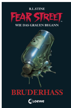
Fear Street 32 - Bruderhass