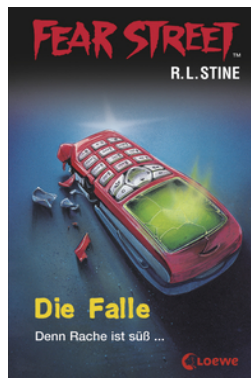
Fear Street 31 - Die Falle