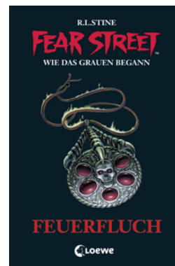
Fear Street 33 - Feuerfluch