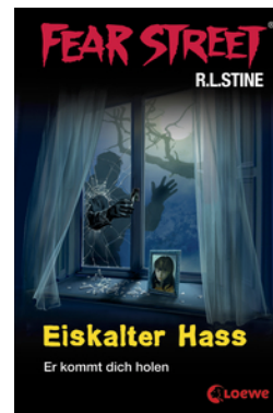
Fear Street 29 - Eiskalter Hass