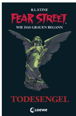
Fear Street 35 - Todesengel