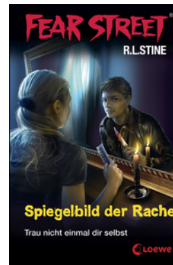
Fear Street 25 - Spiegelbild der Rache