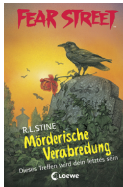
Fear Street 26 - Mörderische Verabredung