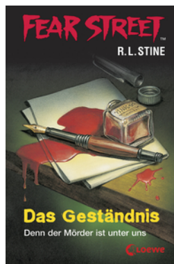
Fear Street 34 - Das Geständnis