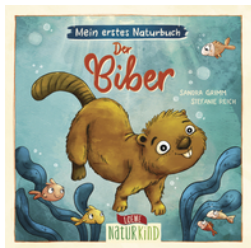
Mein erstes Naturbuch - Der Biber