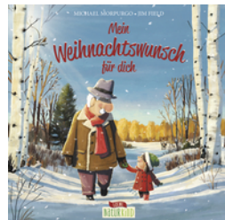
Mein Weihnachtswunsch für dich