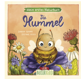
Mein erstes Naturbuch - Die Hummel