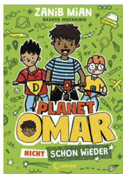
Planet Omar (Band 3) - Nicht schon wieder