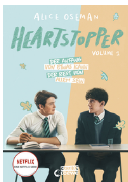
Heartstopper Volume 1