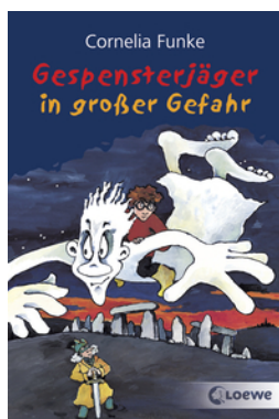
Gespensterjäger in großer Gefahr