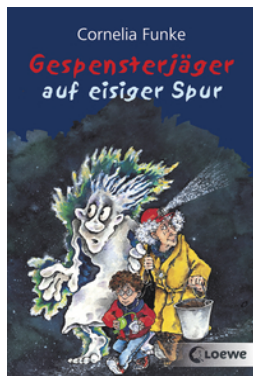
Gespensterjäger auf eisiger Spur