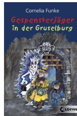
Gespensterjäger in der Gruselburg