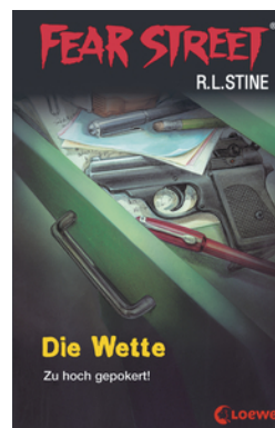
Fear Street 56 - Die Wette