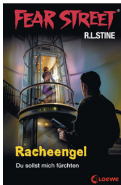
Fear Street 60 - Racheengel