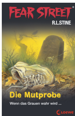
Fear Street 58 - Die Mutprobe