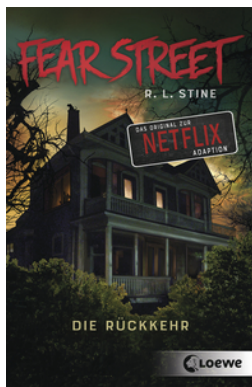
Fear Street - Die Rückkehr