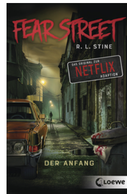
Fear Street - Der Anfang