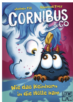
Cornibus & Co. (Band 4) - Wie das Keinhorn in die Hölle kam