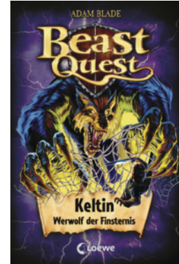
Beast Quest (Band 68) - Keltin, Werwolf der Finsternis