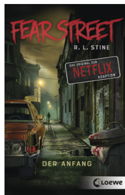
Fear Street - Der Anfang