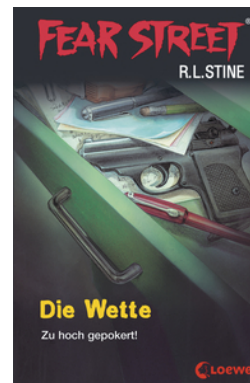
Fear Street 56 - Die Wette