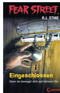
Fear Street 53 - Eingeschlossen