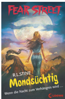
Fear Street 57 - Mondsüchtig