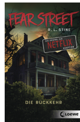
Fear Street - Die Rückkehr