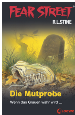
Fear Street 58 - Die Mutprobe