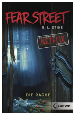
Fear Street - Die Rache