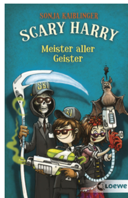
Scary Harry (Band 3) - Meister aller Geister