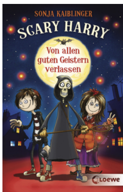
Scary Harry (Band 1) - Von allen guten Geistern verlassen