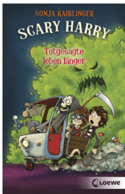
Scary Harry (Band 2) - Totgesagte leben länger