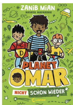
Planet Omar (Band 3) - Nicht schon wieder