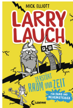
Larry Lauch zerstört Raum und Zeit