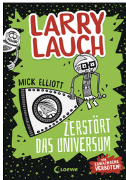
Larry Lauch zerstört das Universum (Band 2)