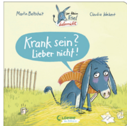
Der kleine Esel Liebernickt - Krank sein? Lieber nicht!