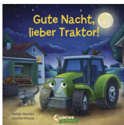
Gute Nacht, lieber Traktor!