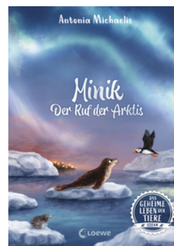
Das geheime Leben der Tiere (Ozean) - Minik - Der Ruf der Arktis