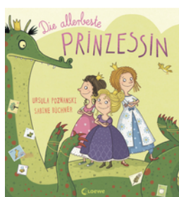
Die allerbeste Prinzessin