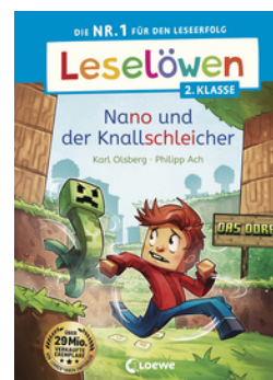
Leselöwen 2. Klasse - Nano und der Knallschleicher