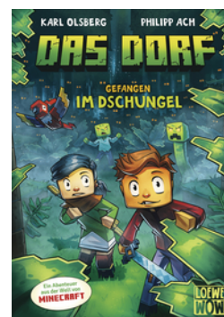
Das Dorf (Band 3) - Gefangen im Dschungel