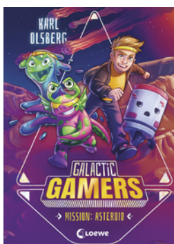
Galactic Gamers (Band 2) - Mission: Asteroid