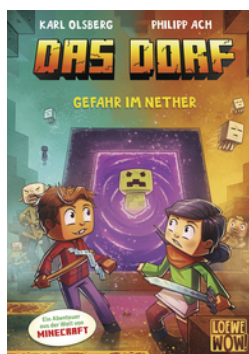
Das Dorf (Band 2) - Gefahr im Nether