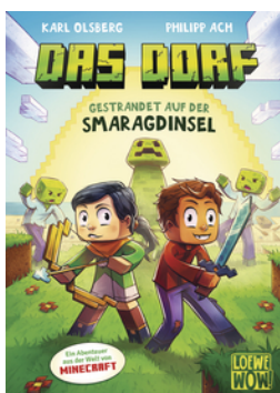
Das Dorf (Band 1) - Gestrandet auf der Smaragdinsel