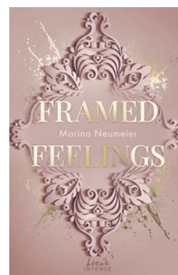
Framed Feelings (Golden Hearts, Band 1)