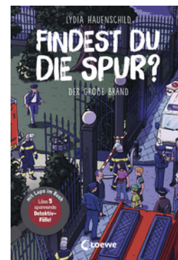
Findest du die Spur? - Der große Brand