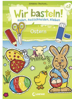
Wir basteln! - Malen, Ausschneiden, Kleben - Ostern