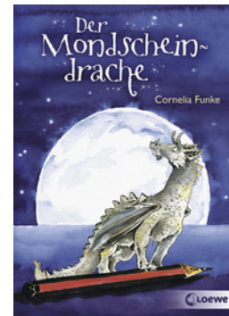
Der Mondschein- drache

... und 37 weitere Titel des Autors vorhanden.