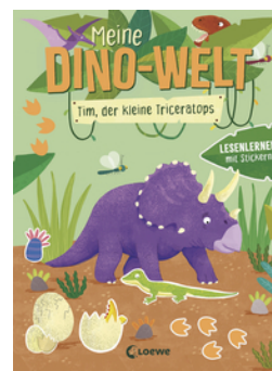
Meine Dino-Welt - Tim, der kleine Triceratops