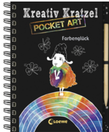
Kreativ-Kratzel Pocket Art: Farbenglück