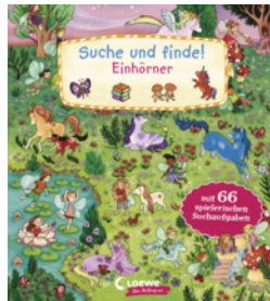
Suche und finde! Einhörner