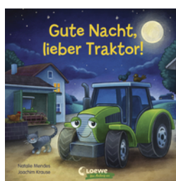
Gute Nacht, lieber Traktor!