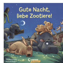
Gute Nacht, liebe Zootiere!