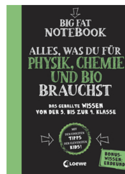
Big Fat Notebook - Alles, was du für Physik, Chemie und Bio brauchst - Das geballte Wissen von der 5. bis zur 9. Klasse. Mit Bonuswissen: Erdkunde