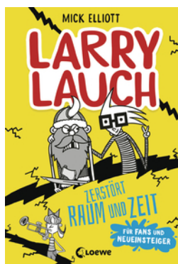
Larry Lauch zerstört Raum und Zeit