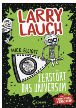
Larry Lauch zerstört das Universum (Band 2)