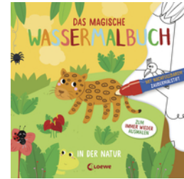
Das magische Wassermalbuch - In der Natur