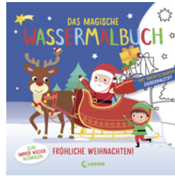
Das magische Wassermalbuch - Fröhliche Weihnachten!