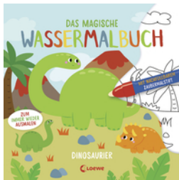
Das magische Wassermalbuch - Dinosaurier