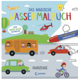
Das magische Wassermalbuch - Fahrzeuge