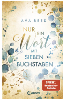
Nur ein Wort mit sieben Buchstaben