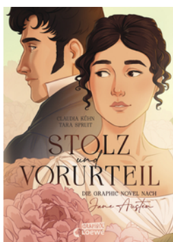
Stolz und Vorurteil - Die Graphic Novel nach Jane Austen