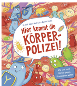
Hier kommt die Körperpolizei!