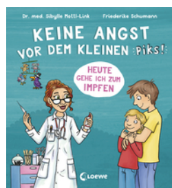
Keine Angst vor dem kleinen Piks!