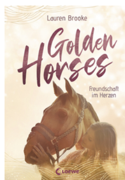
Golden Horses (Band 3) - Freundschaft im Herzen