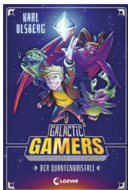
Galactic Gamers (Band 1) - Der Quantenkristall