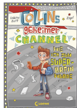
Collins geheimer Channel (Band 4) - Wie ich zum Super- Brain wurde