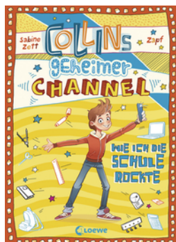
Collins geheimer Channel (Band 2) - Wie ich die Schule rockte