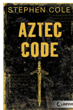
Aztec Code (Band 2)