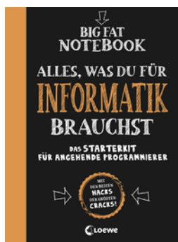
Big Fat Notebook - Alles, was du für Informatik brauchst