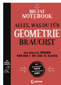
Big Fat Notebook - Alles, was du für Geometrie brauchst