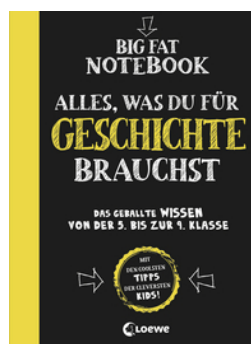
Big Fat Notebook - Alles, was du für Geschichte brauchst