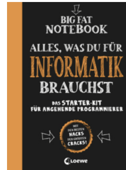
Big Fat Notebook - Alles, was du für Informatik brauchst - Das Starterkit für angehende Programmierer