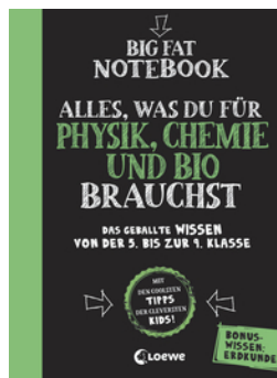
Big Fat Notebook - Alles, was du für Physik, Chemie und Bio brauchst - Das geballte Wissen von der 5. bis zur 9. Klasse. Mit Bonuswissen: Erdkunde