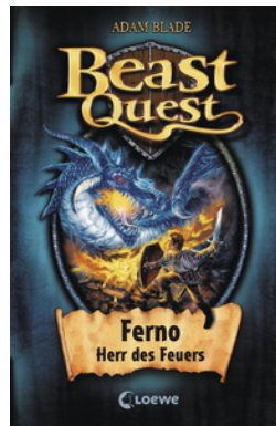
Beast Quest (Band 1) - Ferno, Herr des Feuers