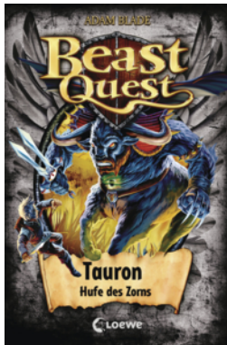
Beast Quest (Band 66) - Tauron, Hufe des Zorns