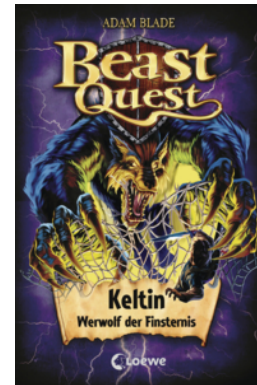
Beast Quest (Band 68) - Keltin, Werwolf der Finsternis